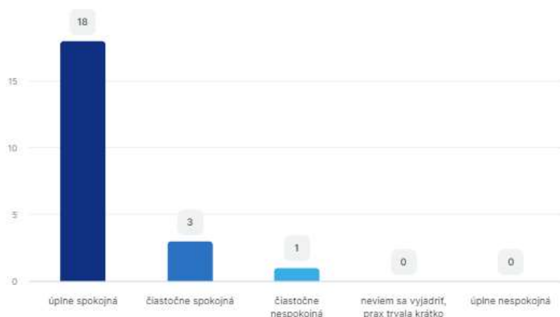
Graf 2 Stanovisko k výroku: So spôsobom, ako s nami cvičná učiteľka komunikovala som bola.....(vyberte jednu odpoveď)

Respondentky konkretizovali, čo na práci cvičných učiteliek najviac oceňovali. Niektoré ich výroky sú prezentované v tabuľke nižšie. Výpovede, kde respondentky len stručne konštatovali, že oceňujú komunikáciu s nimi a s deťmi do tabuľky nezahrňame. Mnohé z nižšie zobrazených výpovedí zachytávajú síce aj ocenenie komunikácie, ale aj iné kvality cvičných učiteliek.