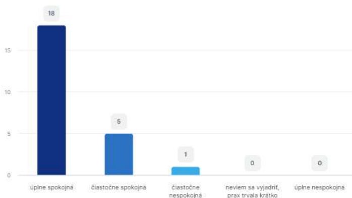
Graf 3 Stanovisko k výroku: So spôsobom, ako mi cvičná učiteľka viedla rozbor som bola (vyberte len jednu odpoveď):